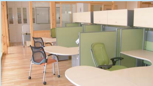
事務室・個別相談コーナー